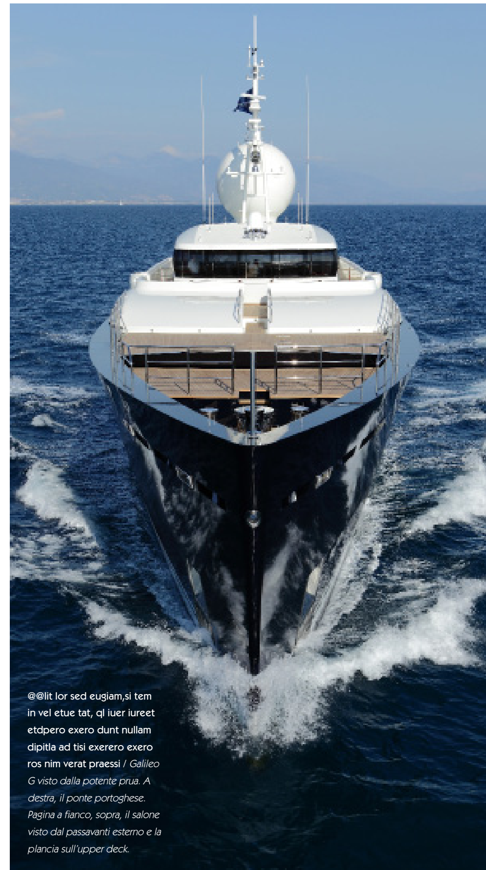
@lit lor sed eugiam, si tem in vel etue tat, ql iuer iureet etdpero exero dunt nullam dipitla ad tisi exerero exero ros nim verat praessi / Galileo G visto dalla potente prua. A destra, il ponte portoghese. Pagina a fianco, sopra, il salone visto dal passavanti esterno e la plancia sull'upper deck.