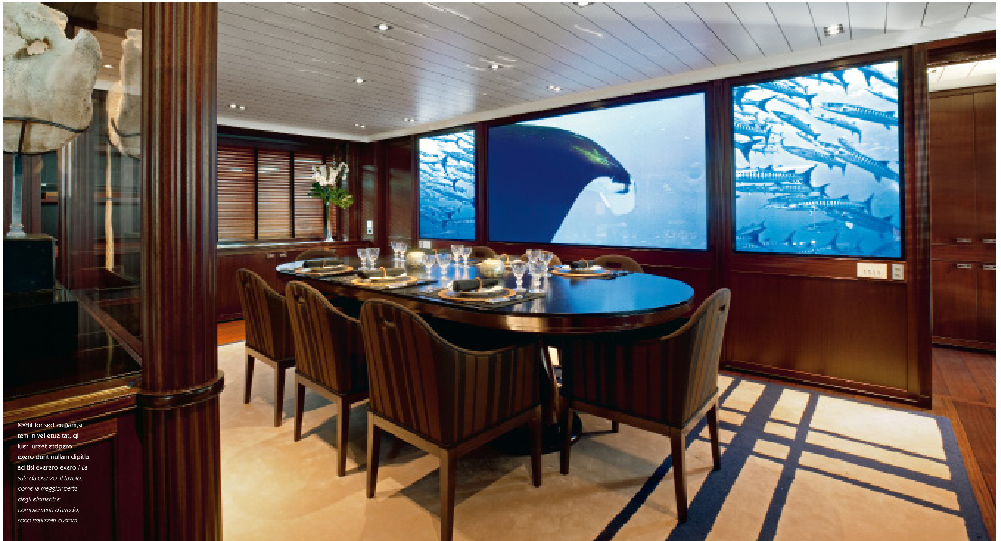
@lit lor sed eugiam, si tem in vel etue tat, ql iuer iureet etdpero exero dunt nullam dipitla ad tisi exerero exero / La sala da pranzo. Il tavolo, come la maggior parte degli elementi e complementi d'arredo, sono realizzati custom.