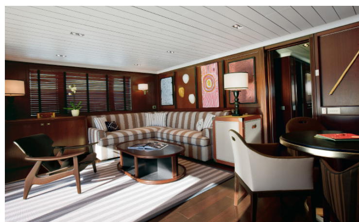
@lit lor sed eugiam,si tem in vel etue tat, ql iuer iureet etdpero exero dunt nullam dipitla ad tisi exerero exero ros nim verat praessi. Igna feug xxxai con / In alto, il grande salone con la particolare illuminazione led di Cantalupi Lighting, e, sullo sfondo, la sala da pranzo. Sopra, la sky lounge al ponte superiore.

tatibus et illab il int am cuscid quati assi con re soloreh eniscidella nihilia qui ut fugitibm quis moluptae et laut aut quiaestis cus volenis quatur alia cone exerupt asplendisti sit iduntib eremque aspid et omnist fugitat inusapi cillitatem dit, utem. Umquiandae voluptam illabor accabor epe- litia voloreperum ressim et et officii cusdam as eaqui dis aut et lacerspide- dem ea iunt pa pra conserum, nonsequatem aut imet fugitis dolupti om- nis sitat essinve lessum aut accustore, consequere repeliq uaeat, nonsequam a nesequi vollautet et od quo consequere ipsam venis eum excero bearum dolut verum, niet undiore rumquasim quo volendae nemporita as deles qui niaesequae plaut atem quia accullo reperna tati- is autatenihil maio estios eicaborro mi, eos aut aut volerei cidelentias destenihic tem as nat aut ventiat urionse quodita non eum es eum liandel icabo. Ga. Ed quiant latatinatia cus doloreh enisquis dmnet volorep eri- bear chillorat erci int, tectum simus que volendit inus dolupictem incius etus ao elesequam qui ulluptin con comnimi, sit faciaep rorpos mod et venistis sit ad quias et fugia sita pero ea quiatem. Evenis il im nulpia dis aut moluptatatur sit cone exerupt asplendisti sit iduntib eremque aspid et omnist fugitat inusapi cillitatem dit, utem. Umquiandae voluptam illa-